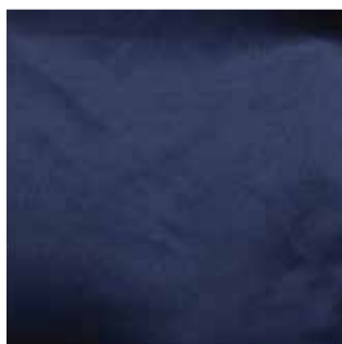
Item : HC MICRO SOFTY Composition : 100% Polyester GSM : 220 Apx