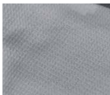
Item : MESH Composition : polyester cotton GSM : 150 - 220 Apx