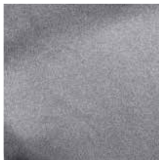
Item : KOOLTEX GRINDLE Composition : 100% Polyester GSM : 200 Apx