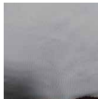
Item : SIGNATURE KNIT Composition : 100% Polyester GSM : 170 Apx