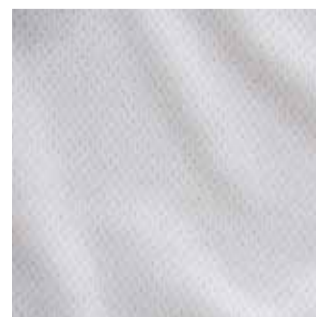
Item : WHITE MESH Composition : 100% Polyester GSM : 180 Apx