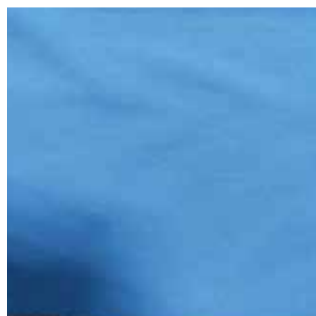
Item : NOVA KNIT Composition : 100% Polyester GSM : 210 Apx