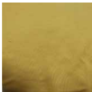
Item : MICRO PLAIN Composition : 100% Polyester GSM : 170 Apx