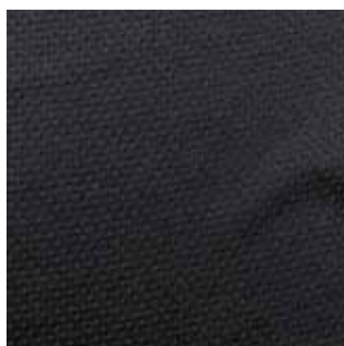
Item : CROWN Composition : 100% Polyester GSM : 220 Apx