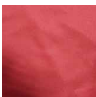
Item : PLAIN POLYESTER Composition : 100% Polyester GSM : 140 Apx