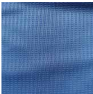
Item : NOVA KNIT Composition : 100% Polyester GSM : 190 Apx