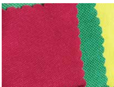
Item : Honey comb Composition : polyester cotton GSM : 150 - 220 Apx