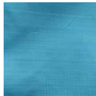
Item : KOOLTEX BARCODE Composition : 100% Polyester GSM : 150 Apx