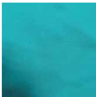
Item : NEXA Composition : 100% Polyester GSM : 170 Apx