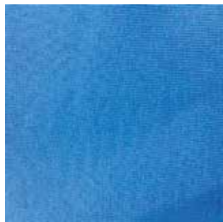
Item : INTERLOCK Composition : SINGLE JERSEY GSM : 150 - 200 Apx