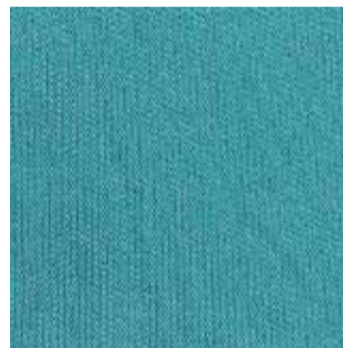
Item : INTERLOCK Composition : Polyester Cotton GSM : 150 - 200 Apx