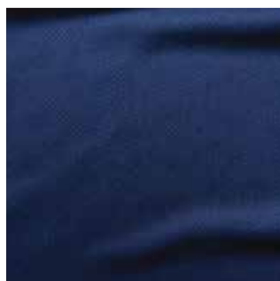
Item : HC MICRO SHIRT SOFTY Composition : 100% Polyester GSM : 220 Apx