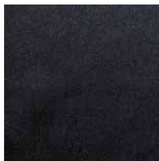
Item : MICRO PP HEAVY Composition : 100% Polyester GSM : 240 Apx